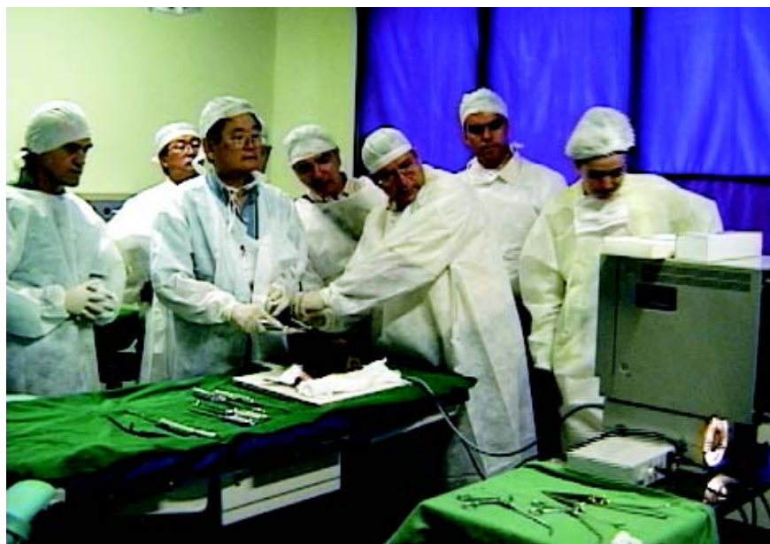
Treinamento em cabeça de animal