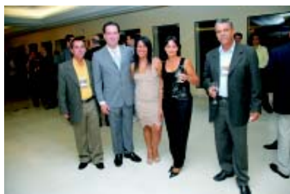
O presidente da Regional com alguns fornecedores