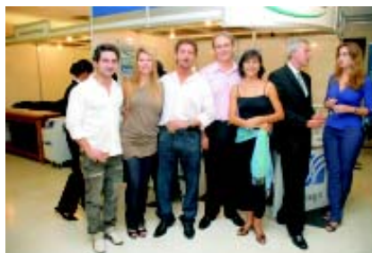
Participantes do evento no coquetel de confraternização