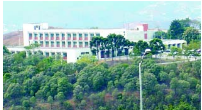
Hospital Universitário da UFJF

O Serviço de Cirurgia Plástica de Juiz de Fora é lotado em duas unidades: no antigo hospital da Universidade, funciona a Unidade Santa Catarina, e, no novo, o Centro de Atenção à Saú-